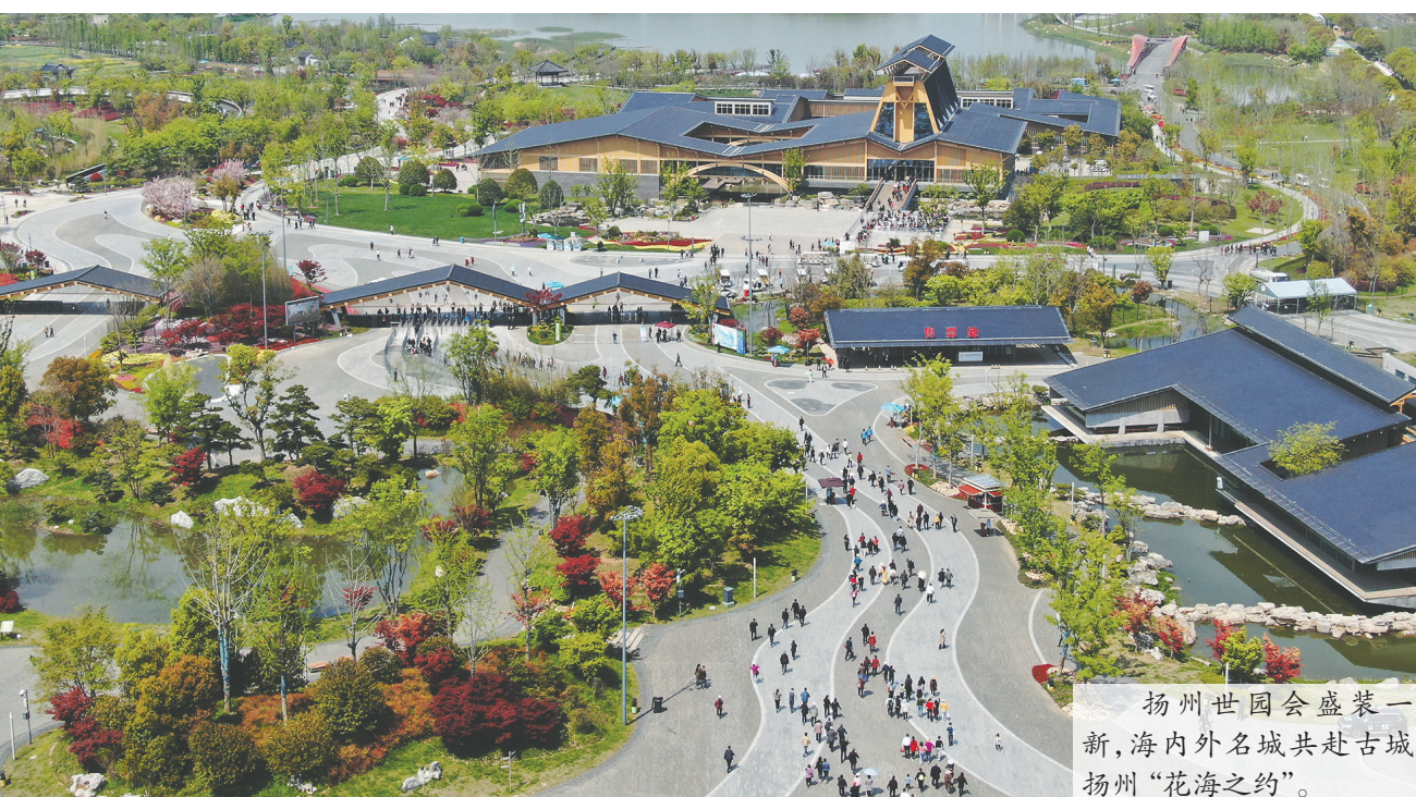
扬州世园会盛装一新,海内外名城共赴古城扬州“花海之约”。