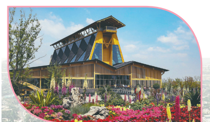
↑海内外名城共赴古城扬州“花海之约”。

即日起,为期184天的世园会正式开门喜迎八方来客。不同时节,将有不同风景。半年后,这片花海还将持续释放“花香”,涵养一方。