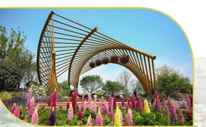
↑全球园艺界的“奥林匹克”盛会——世界园艺博览会的主角为观赏性植物。