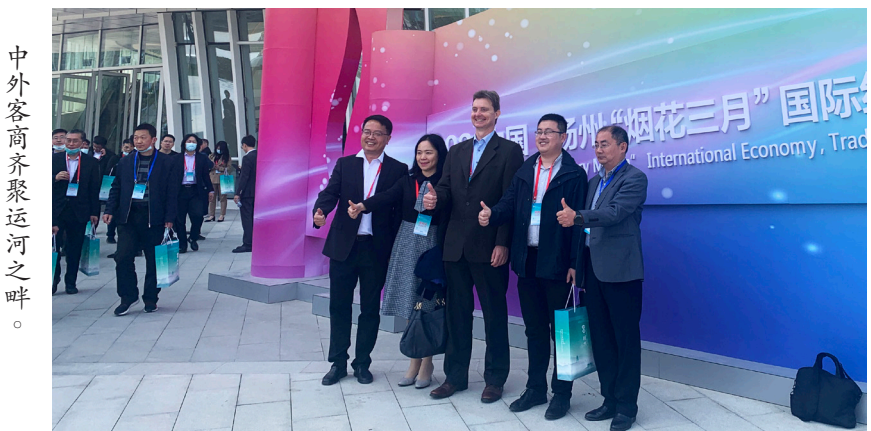
中外客商齐聚运河之畔。